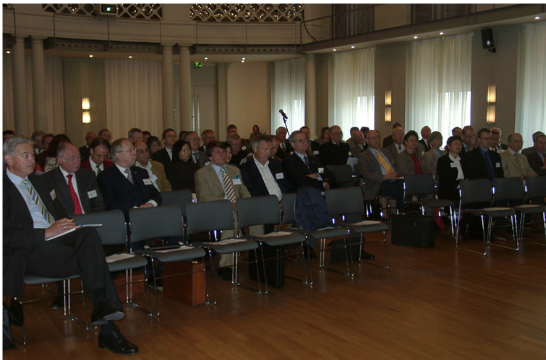
Vertreter Deutsch-Japanischer und Japanisch-Deutscher Gesellschaften