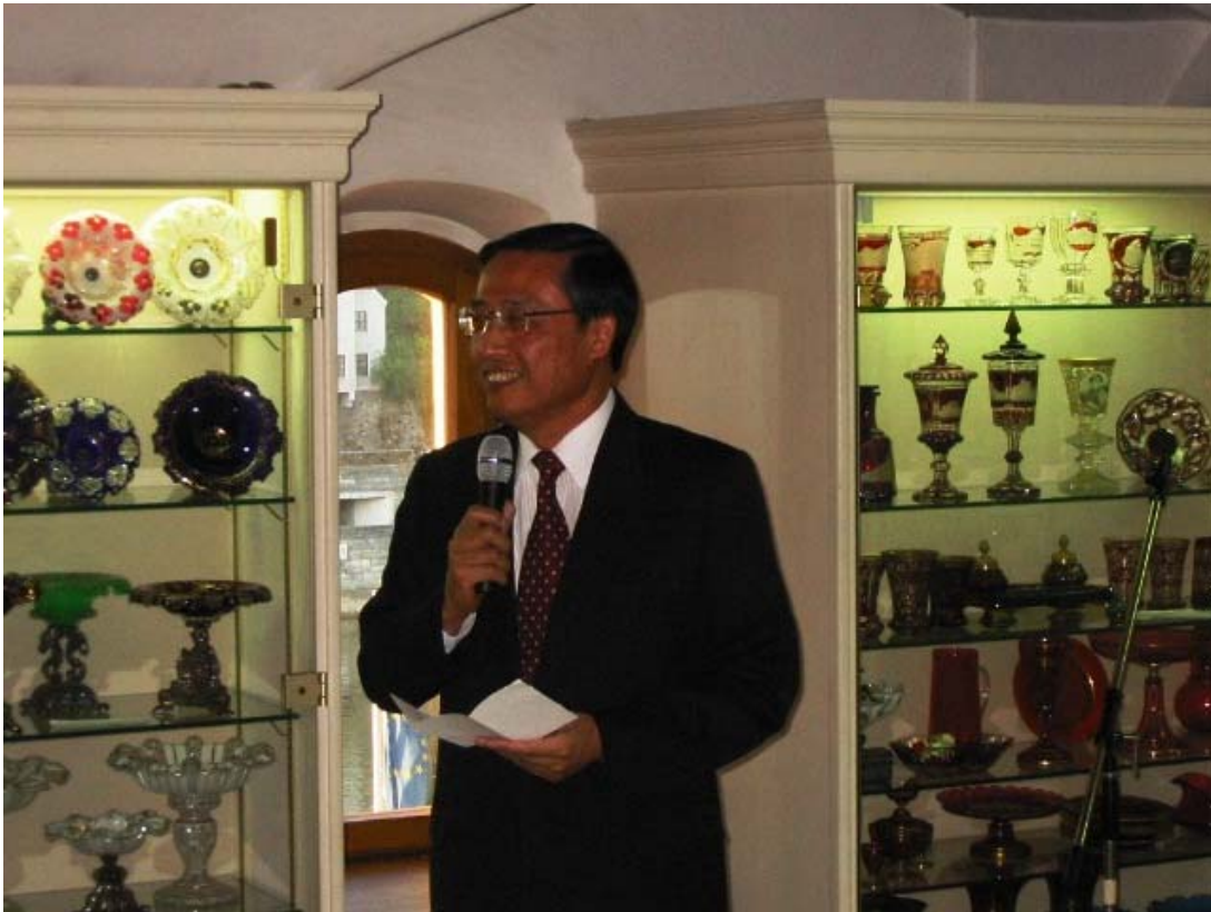
Seine Excellenz, Herr Botschafter Toshiyuki Takano im Passauer Glasmuseum.

Im Anschluss an den Empfang im Rathaus lud der japanische Botschafter zum Abendbuffet im Glasmuseum von Passau ein.