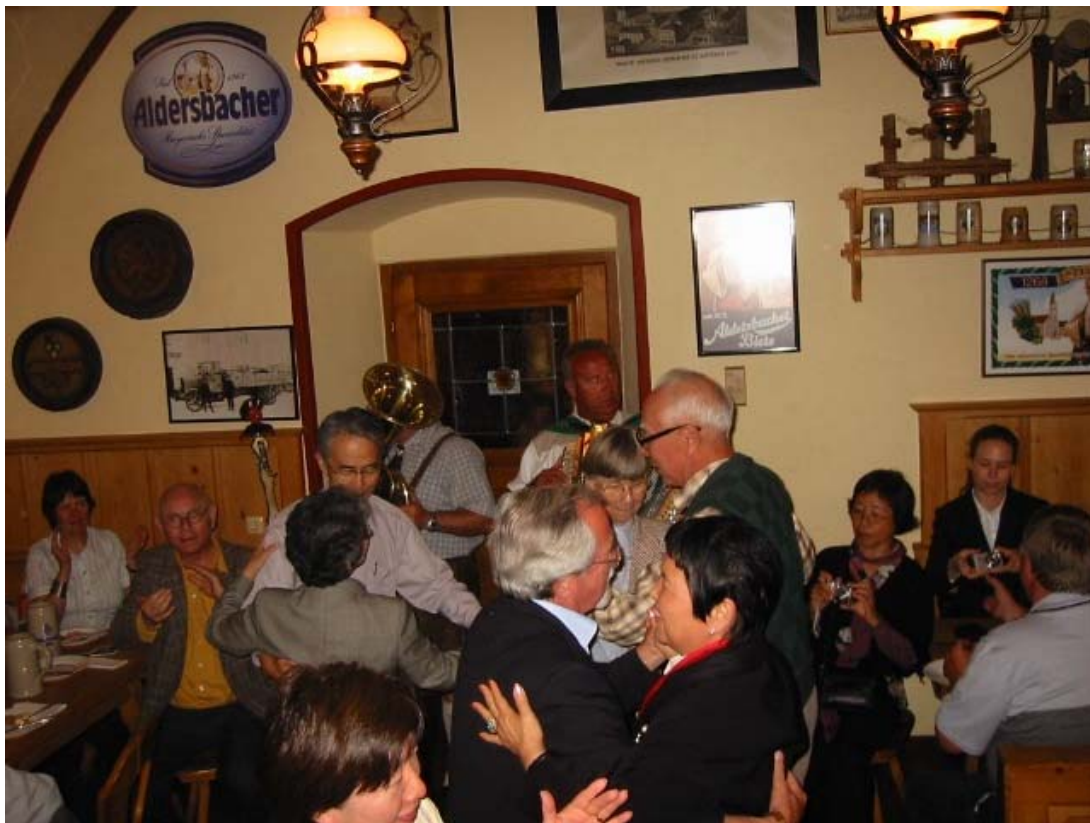
Deutsch-Japanische Freundschaft im Klosterbräustüberl des Klosters Aldersbach.

Der Abend dieses zweiten Tages endete mit einem gemütlichen Zusammensein im Klosterbräustüberl des ehemaligen Klosters Aldersbach mit einem deftigen Brotzeitbuffet und vielen gemeinsam gesungenen japanischen und deutschen Liedern.